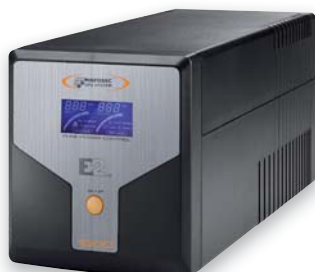
E2 LCD 1000