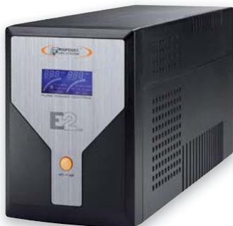
E2 LCD 1500 & 2000