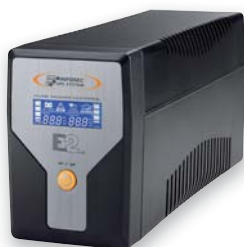
E2 LCD 600 & 800

La gamme d'onduleurs E2 LCD a été conçue pour offrir à vos réseaux et applications informatiques professionnelles une protection fiable et performante contre les problèmes d'alimentation et les perturbations électriques dangereuses.